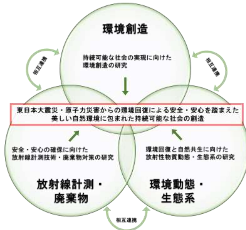
24 図2 調査研究事業イメージ

20 これらの課題等に対応するため、部門を放射線計測・廃棄物、環境動態・生 21 態系、環境創造の3つに再編し、東日本大震災・原子力災害からの環境回復に 22 による安全・安心を踏まえた、美しい自然環境に包まれた持続可能な社会の創造 23 に向け、調査研究に取り組む(図2 調査研究事業イメージ)。