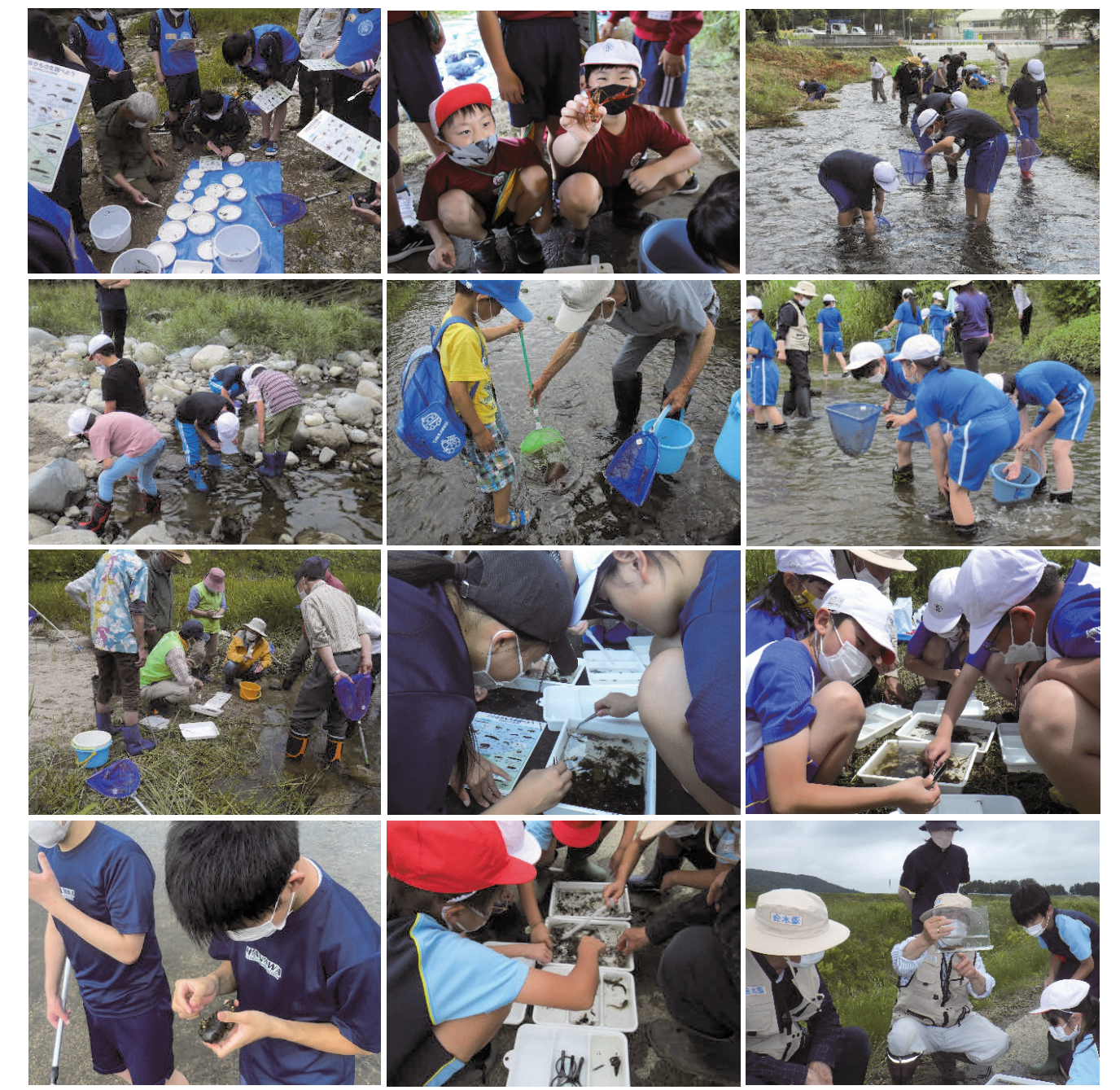
※写真を提供して下さったせせらぎスクール参加団体の写真を掲載しております。